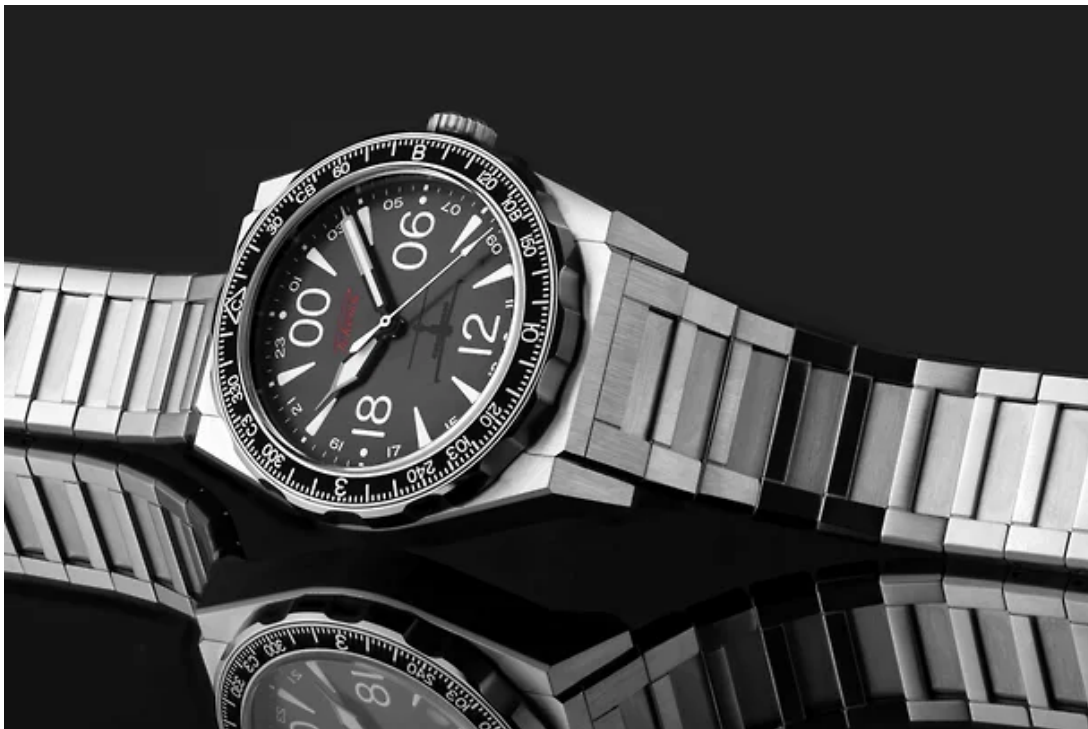
Часы «Ракета Экраноплан»

Спортивные стальные часы на стальном браслете, выпущенные в 500 экземплярах, посвящены советскому кораблю-самолету — экраноплану «Лунь» (из его металла сделана вставка двунаправленного безеля).