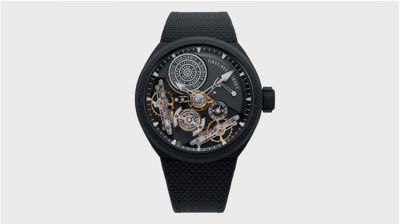
Часы Greubel Forsey Double Balancier Convexe

Первые часы марки с карбоновым корпусом уменьшенного до 42,5 мм диаметра (две серии по 22 экземпляра). Главная приманка механизма — два балансовых колеса, наклоненных под углом 30° и соединенных дифференциалом.