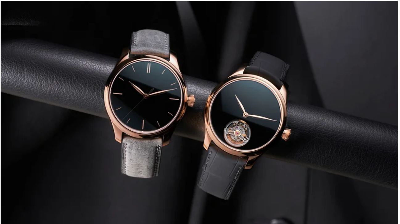
Часы H.Moser & Cie.Endeavour Centre Seconds Vantablack