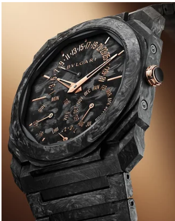
Часы Bvlgari Octo Finissimo Carbongold Perpetual Calendar

Среди часов, которые привезла на GWD марка Bvlgari,— пара моделей рекордно тонких Octo Finissimo в корпусе из антрацитового углеродного волокна с отделкой розовым золотом.