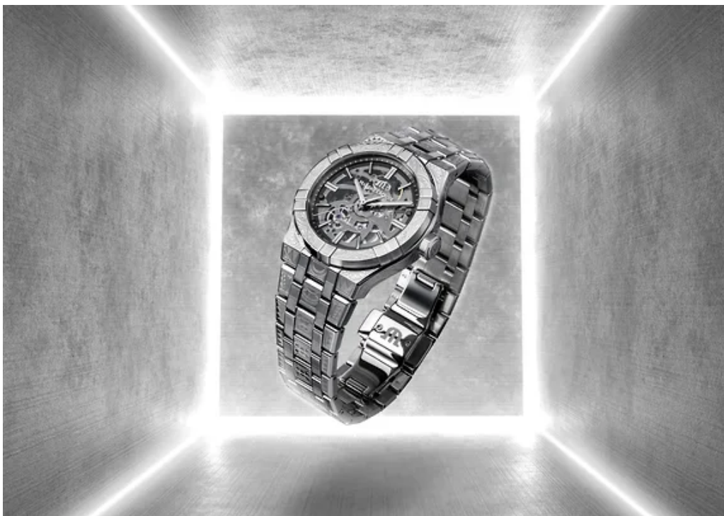
Часы Maurice Lacroix Aikon Skeleton Urban Tribe

Скелетонированный циферблат вторит геометрическим узорам лазерной гравировки на корпусе и браслете. Серия из 500 экземпляров.