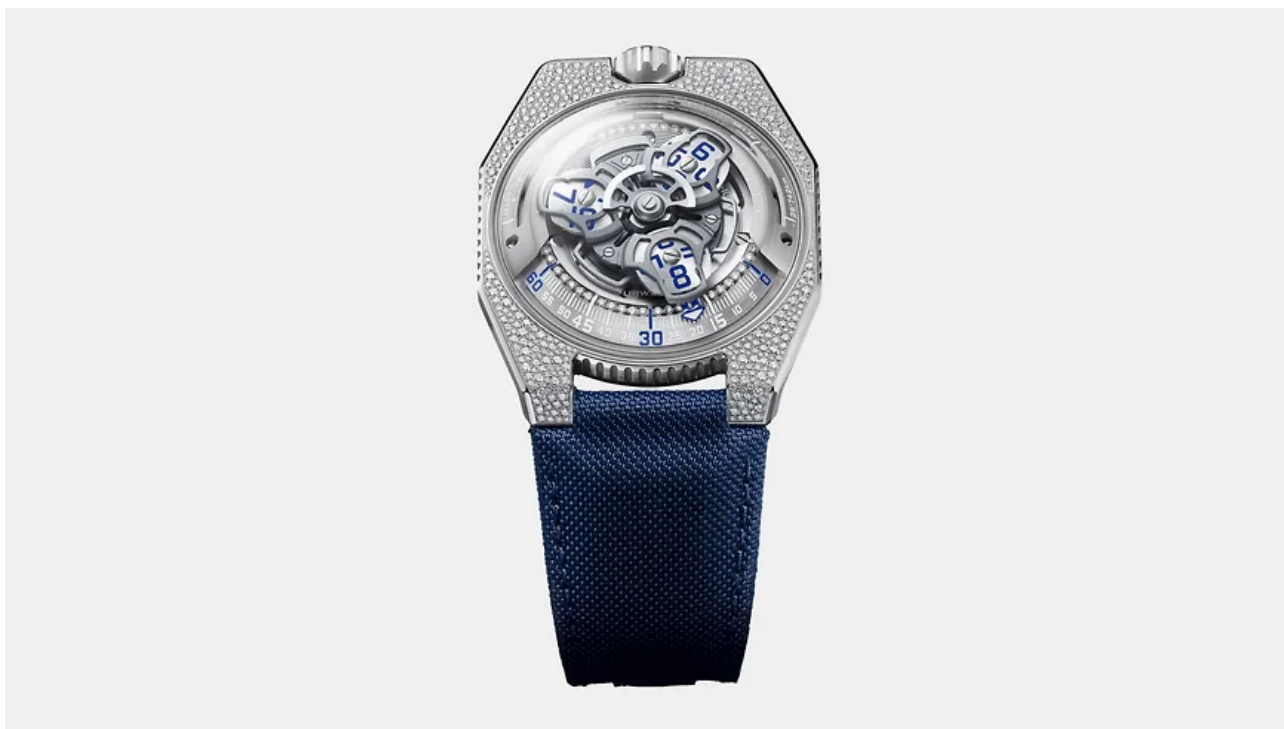
Часы Urwerk UR-100V Stardust

Как и вся коллекция 100, часы имеют кроме сателлитных указателей времени шкалу расстояний, которые проходит Земля, вращаясь вокруг оси за 20 минут, а также Земли вокруг Солнца за ту же треть часа. Чтобы почувствовать эти космические величины на ощупь, новая версия вышла с корпусом, инкрустированным «звездной пылью» из 400 бриллиантов. Производство ограничено десятью экземплярами в год.