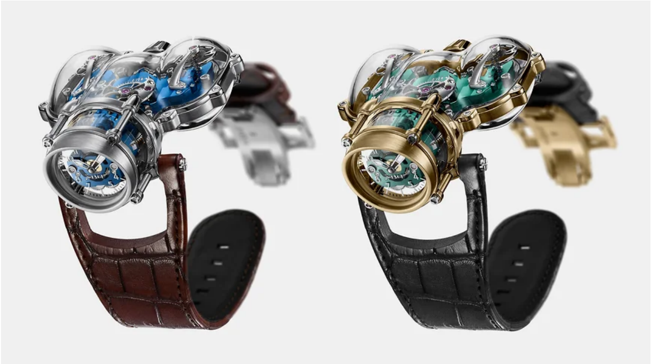
Часы MB&F Horological Machine №9 Sapphire Vision

Модель, разработанная вместе с часовым дизайнером Эриком Жиру, напоминает фантастический глубоководный аппарат. Сложная капсула из сапфирового стекла открывает взгляду «самый красивый», по словам основателя MB&F Максимилиана Бюссера, из когда-либо созданных мануфактурных механизмов. Шесть серий по пять экземпляров.