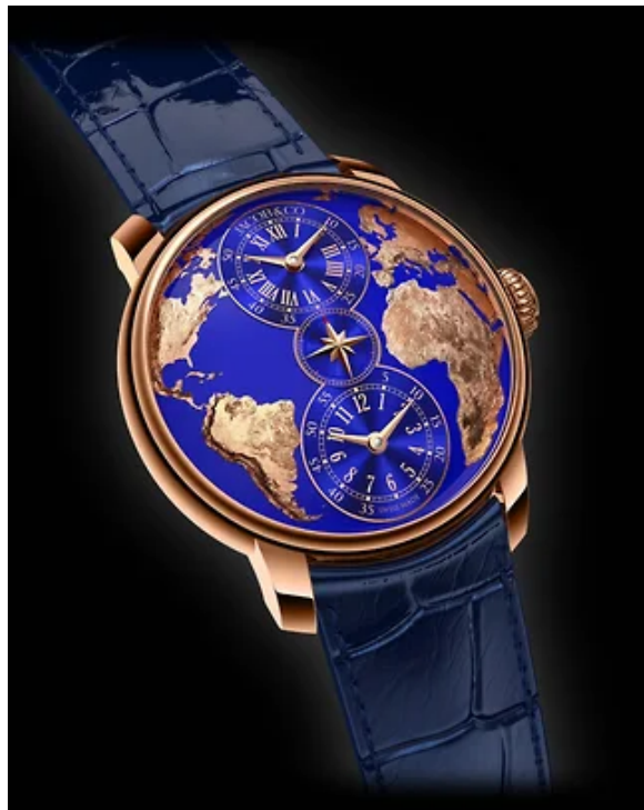
Часы Jacob & Co The World Is Yours Dual Time Zone