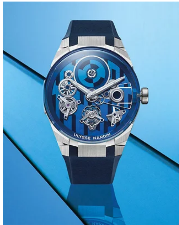
Часы Ulysse Nardin Blast Free Wheel Marquetry