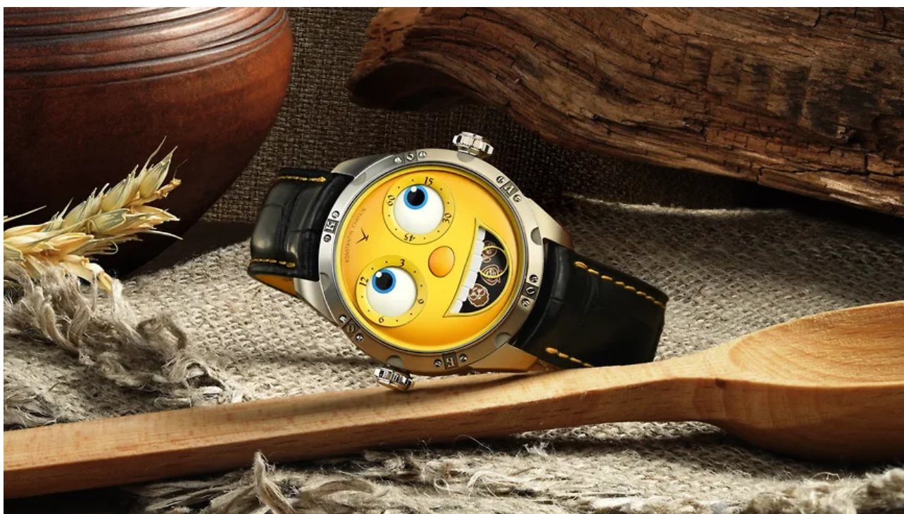
Часы Константин Чайкин «Колобок»