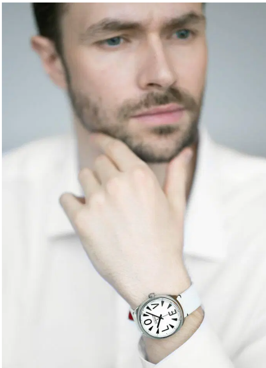
La Raketa Big Love sur un poignet masculin

La montre Raketa "Big Love" est produite en quantité limitée à 200 modèles en 2023. Elle est vendue au tarif de 1333 Euros (hors TVA), chez les détaillants de la marque ou sur le site internet avec une livraison gratuite par DHL.