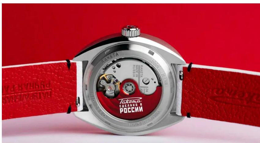
Vue sur le calibre 2615.

Le fond de la montre laisse voir le mouvement automatique Raketa calibre 2615 minutieusement décoré des côtes de Neva et d'une très jolie masse oscillante rouge, le tout entièrement manufacturé en interne à la Manufacture horlogère Raketa à Peterhof.