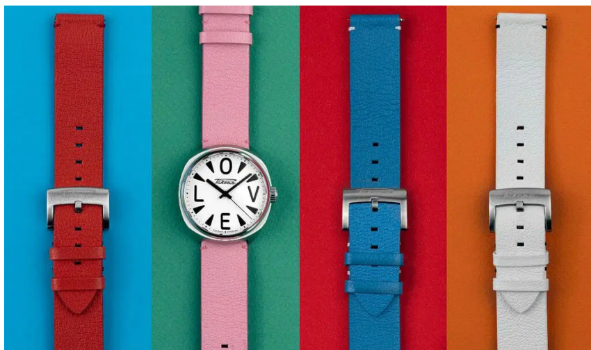
La Raketa Big Love et ses 4 bracelets.

Le fond de la montre laisse voir le mouvement automatique Raketa calibre 2615 minutieusement décoré des côtes de Neva et d'une très jolie masse oscillante rouge, le tout entièrement manufacturé en interne à la Manufacture horlogère Raketa à Peterhof.