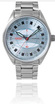
Montre Polar W-45-17-30- 0241