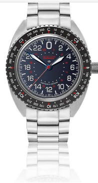
Montre Baikonour W-30- 19-30-0247