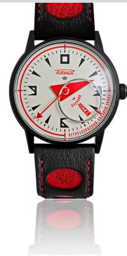
Montre Avant-Garde W-06-16-10-0279