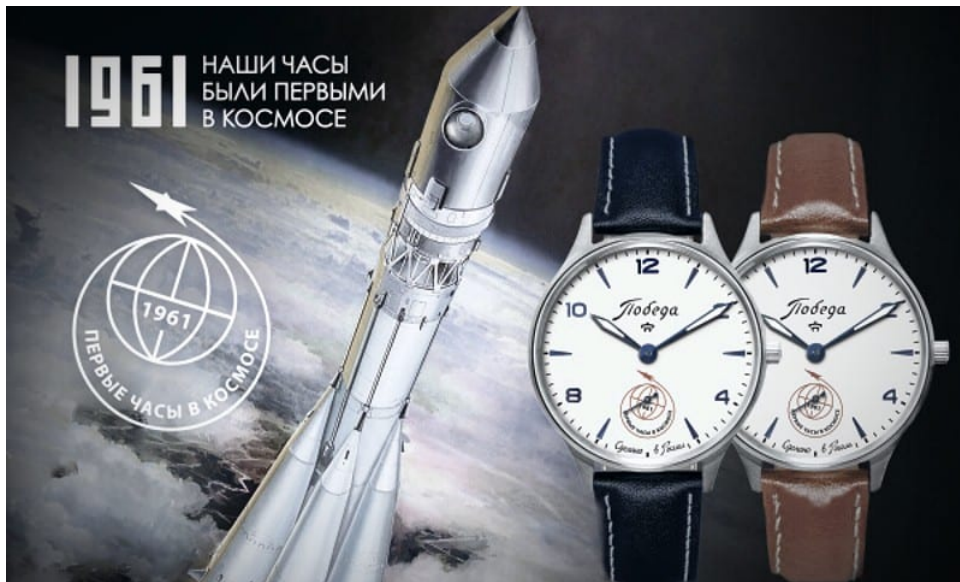
La première montre Pobeda dans l'espace, en 1961

Comme un témoin des ambitions soviétiques, Raketa s'aventure sur tous les terrains. C'est ainsi qu'elle accompagne les explorateurs polaires à l'aube des années 1970, puis qu'elle produit les montres officielles des JO de Moscou en 1980 . Mais en même temps que le bloc de l'Est se fissure, la manufacture russe décline, étant même à deux doigts de disparaître pour de bon.