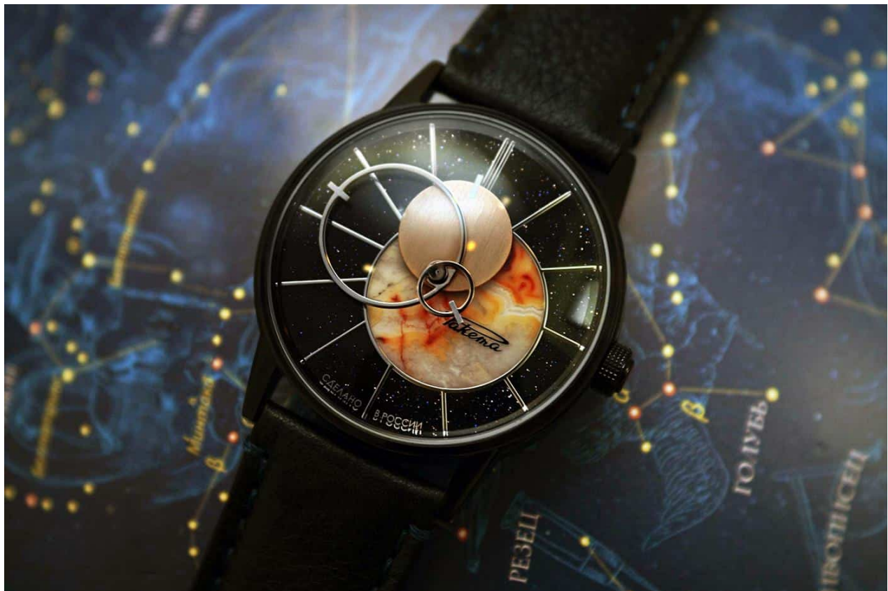
Copernicus Limited Edition (2021)