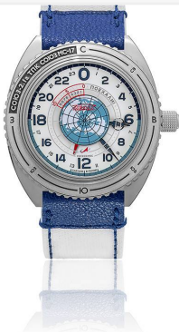
Montre Space Launcher Blanche W-30-19-40-0281