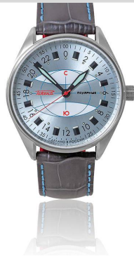
Montre Polar W-45-17-10-0242