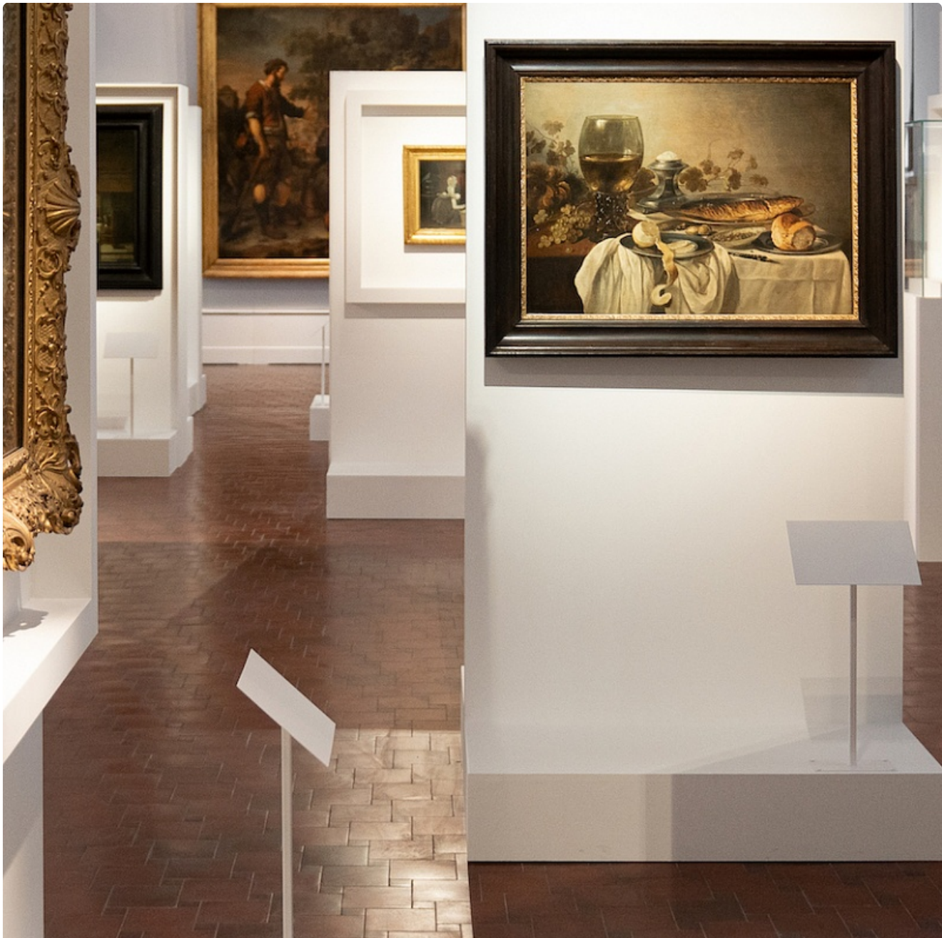
Выставки ( /razvlecheniya/vystavki )