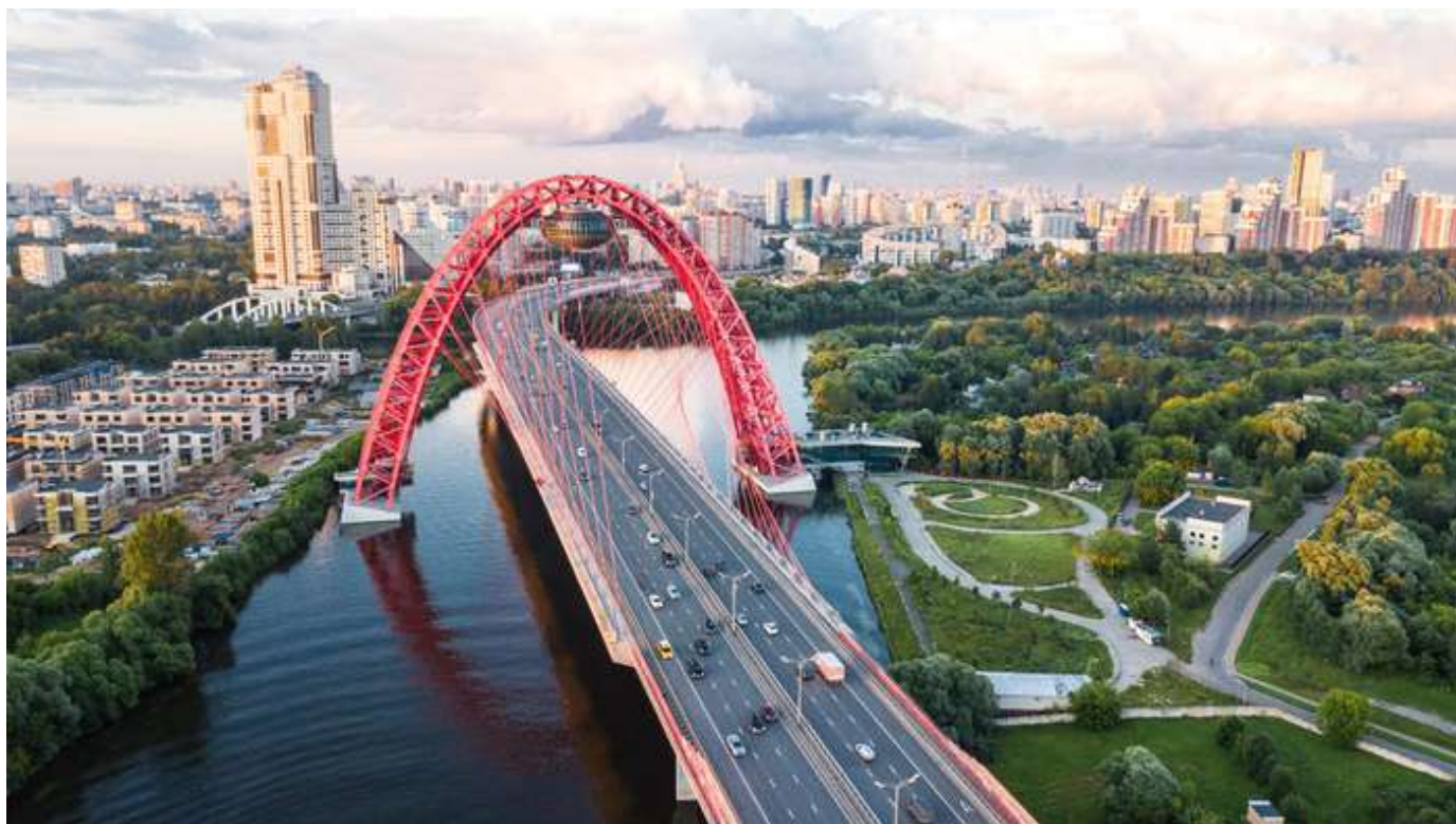
Москва, Живописный мост.

Кстати, именно мы сделали самый большой часовой механизм в Европе, который можно увидеть в Центральном детском магазине. А сейчас мы будем реставрировать часовой механизм Нотр-Дам де Пари.