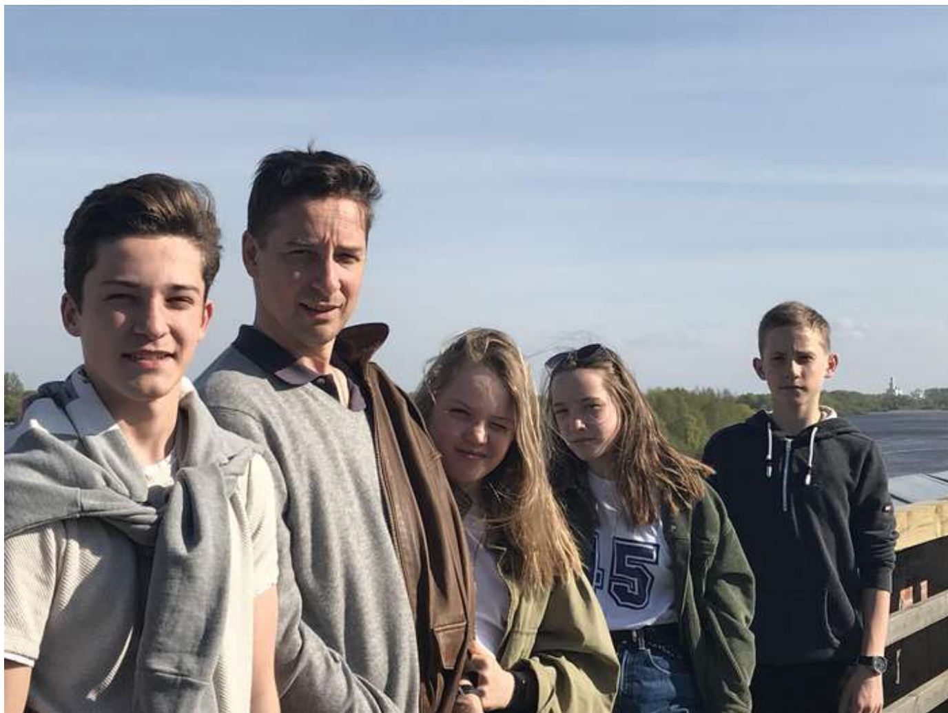
Вместе с детьми

У меня работа не заканчивается никогда: иду домой, сплю, чищу зубы — думаю о «Ракете». Да, я хотел бы отключаться, но не получается. Встаю в семь утра, в девять уже на работе. Каждый день что-то новое — рутины нет. Например, сегодня мы говорили о новой модели часов для космонавтов, потом были обсуждения с производством, потом — интервью для вас. Перерыва нет. Даже в отпуске продолжаю работать.