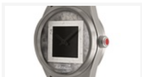
Фото по теме