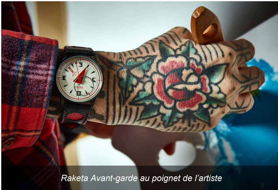
Raketa Avant-garde au poignet de l'artiste

Raketa a voulu s'inspirer de cette communauté d'expression artistique pour revisiter le mouvement. Non pas le mouvement horloger qu'elle maîtrise parfaitement dans sa Manufacture 100 % intégrée, mais le mouvement du temps. En une simplicité folle, la jolie Russe revisite la danse du temps à travers le design d'un cadran, les formes des aiguilles, et le noir d'un environnement.