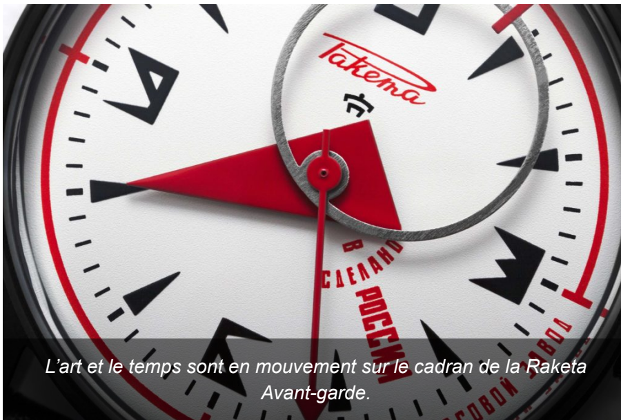
L'art et le temps sont en mouvement sur le cadran de la Raketa Avant-garde.

Raketa a voulu s'inspirer de cette communauté d'expression artistique pour revisiter le mouvement. Non pas le mouvement horloger qu'elle maîtrise parfaitement dans sa Manufacture 100 % intégrée, mais le mouvement du temps. En une simplicité folle, la jolie Russe revisite la danse du temps à travers le design d'un cadran, les formes des aiguilles, et le noir d'un environnement.