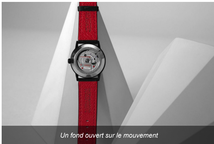
Un fond ouvert sur le mouvement

Le bracelet est réalisé en cuir de veau teinté de noir, et rehaussé de coutures rouges. On le devine avec une superposition de fines couches qui, par un travail d'emporte-pièce de forme ronde, autorise la vision de la couche inférieure de couleur rouge. Ce qui donne un superbe effet rappelant les touches de rouge du cadran et l'habituelle doublure des bracelets des montres Raketa.