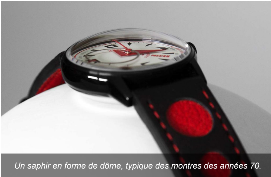
Un saphir en forme de dôme, typique des montres des années 70.

Le boîtier est en acier inoxydable traité PVD (Physical Vapor Deposition) noir. Glace saphir en forme de dôme côté cadran et verre minéral côté mouvement permettent respectivement d'avoir un effet néo-vintage au porté, et une ouverture généreuse sur le mouvement décoré.