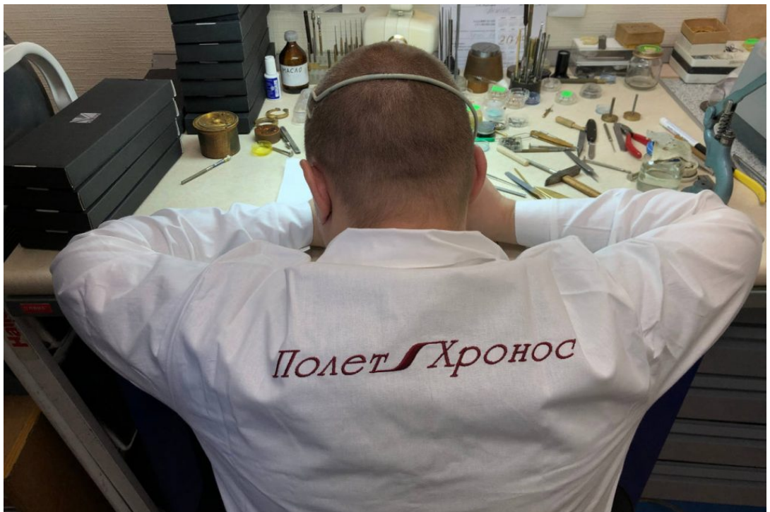
Horloger de l'atelier Poljet au travail

Là où par ailleurs on est en difficulté pour mettre en œuvre une politique de groupe, trois marques russes indépendantes collaborent pour s'ouvrir au monde horloger. Et le choix du « marché cible » n'est autre que la France.