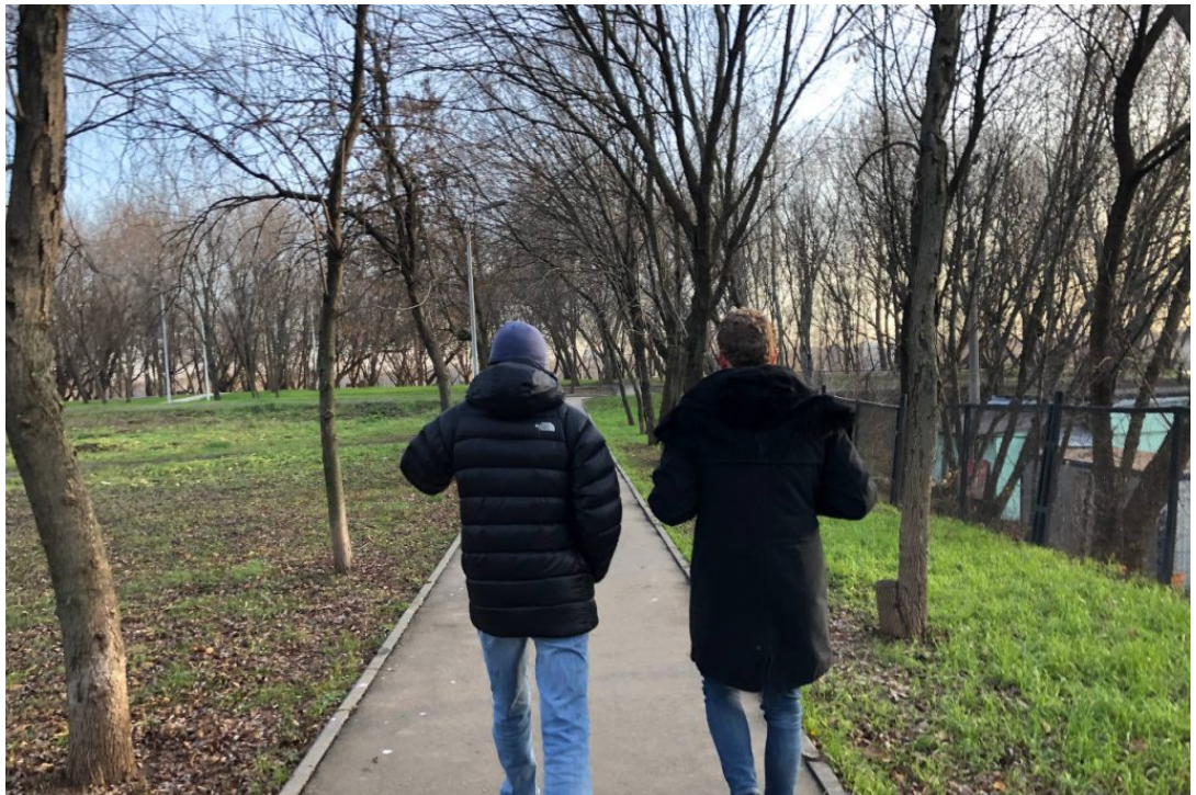
Mobilisation des horlogers russes pour aller de l'avant !

Là où par ailleurs on est en difficulté pour mettre en œuvre une politique de groupe, trois marques russes indépendantes collaborent pour s'ouvrir au monde horloger. Et le choix du « marché cible » n'est autre que la France.