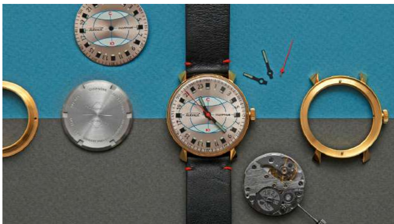
Часы “Ракета Полярные”

Яблоко от яблони недалеко падает. Насколько неформатным явлением для современного мирового часпрома является Петродворцовый часовой завод, выпускающий часы марки “Ракета”, настолько же необычна его свежая премьера. Как классифицировать модель “Ракета Полярные” с индексом 0270? Она не подходит под привычное для швейцарских производителей определение ремейка, то есть современных часов с отдельными элементами ретро-дизайна, позаимствованными у исторического оригинала. Правильнее будет говорить о реплике, хотя сам завод предпочитает сообщать о “возобновлении производства исторической модели”.