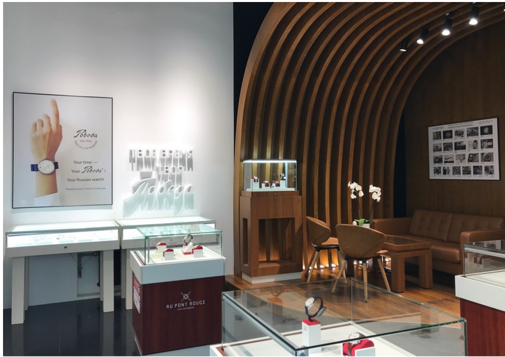
В бутике, открывшемся в универмаге Au Pont Rouge , представлена полная коллекция часового завода.