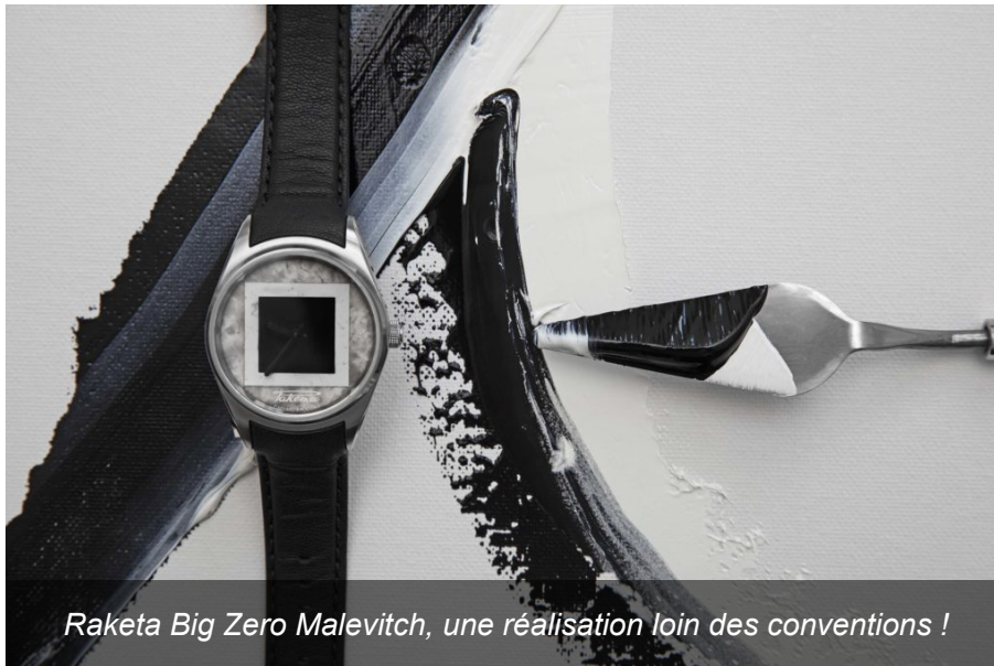
Raketa Big Zero Malevitch, une réalisation loin des conventions !

Cette montre détonante est le fruit d'une collaboration entre la Manufacture Horlogère Raketa et la Galerie d'État Tretiakov , le principal musée d'art national russe.