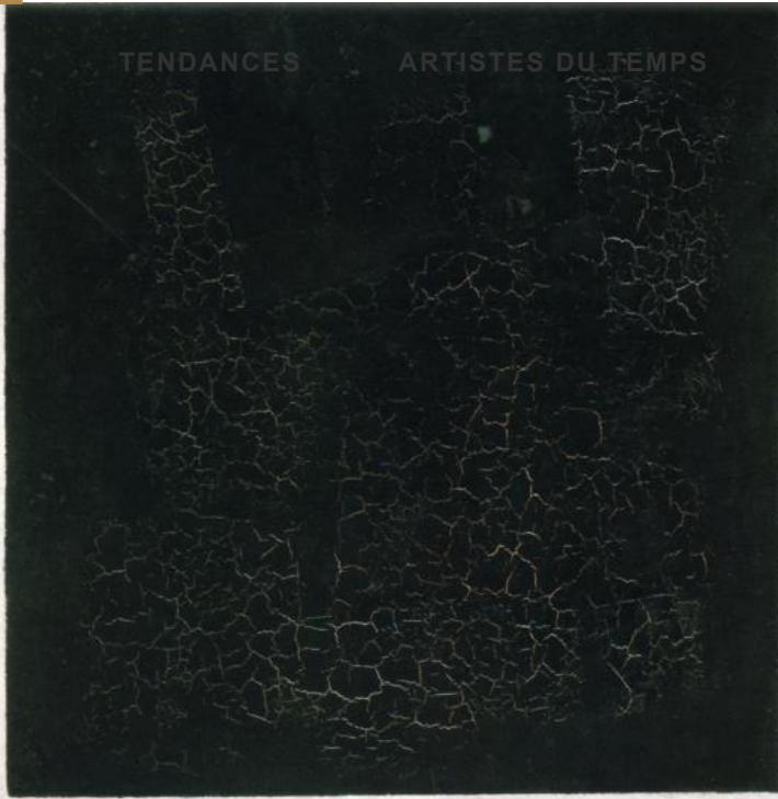
Carré noir sur fond blanc, l'œuvre majeure de Malevitch

Il est possible que la majorité des gens ne vont pas aimer cette montre. Mais ceux qui sont prêts à rompre avec le classicisme traditionnel et à entrer dans une nouvelle réalité esthétique créée à partir de Zéro devraient l'apprécier. Exactement comme le Carré Noir sur fond blanc de Malevitch.