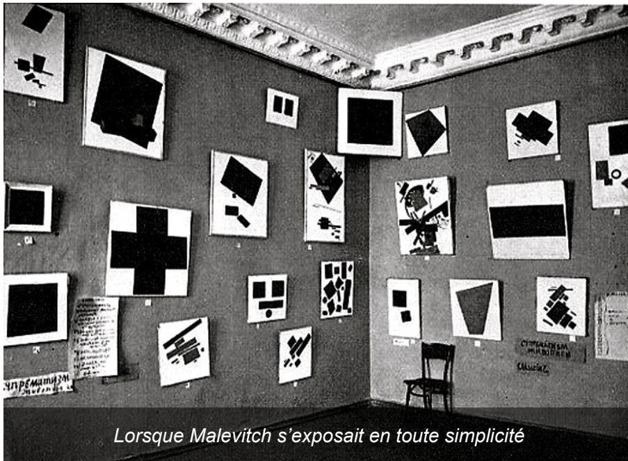
Lorsque Malevitch s'exposait en toute simplicité

Il est possible que la majorité des gens ne vont pas aimer cette montre. Mais ceux qui sont prêts à rompre avec le classicisme traditionnel et à entrer dans une nouvelle réalité esthétique créée à partir de Zéro devraient l'apprécier. Exactement comme le Carré Noir sur fond blanc de Malevitch.