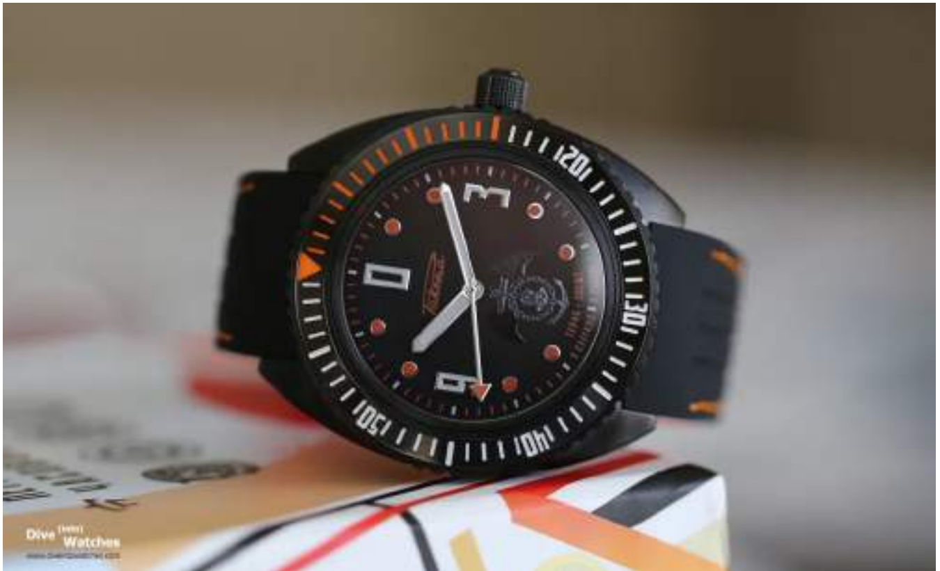
Raketa Amphibia 0256 (Ref. W-85-16-20-0256) mit PVD

In der Kategorie Taucheruhr bietet die russische Marke derzeit ein Modell mit Drehring an, das sich je nach Ausführung preislich zwischen 990 und 1'350 Euro bewegt. Charakteristisch bei allen ist die Null bei 12 Uhr. Die Lünetteneinlage ist aus Keramik, das von einem Modell der 70er-Jahre inspirierte, kissenförmige Gehäuse ist mit einem Sichtglasboden aus Mineralglas ausgestattet und bleibt bis 400 Meter wasserdicht. Im Innern tickt das erwähnte, hauseigene Kal. 2615 mit rund 40 Stunden Gangreserve und manuellem Finish, die Leuchtmasse ist Superluminova, das Glas aus Saphir. Beim Gehäuse gibt's Edelstahl mit oder ohne PVD.