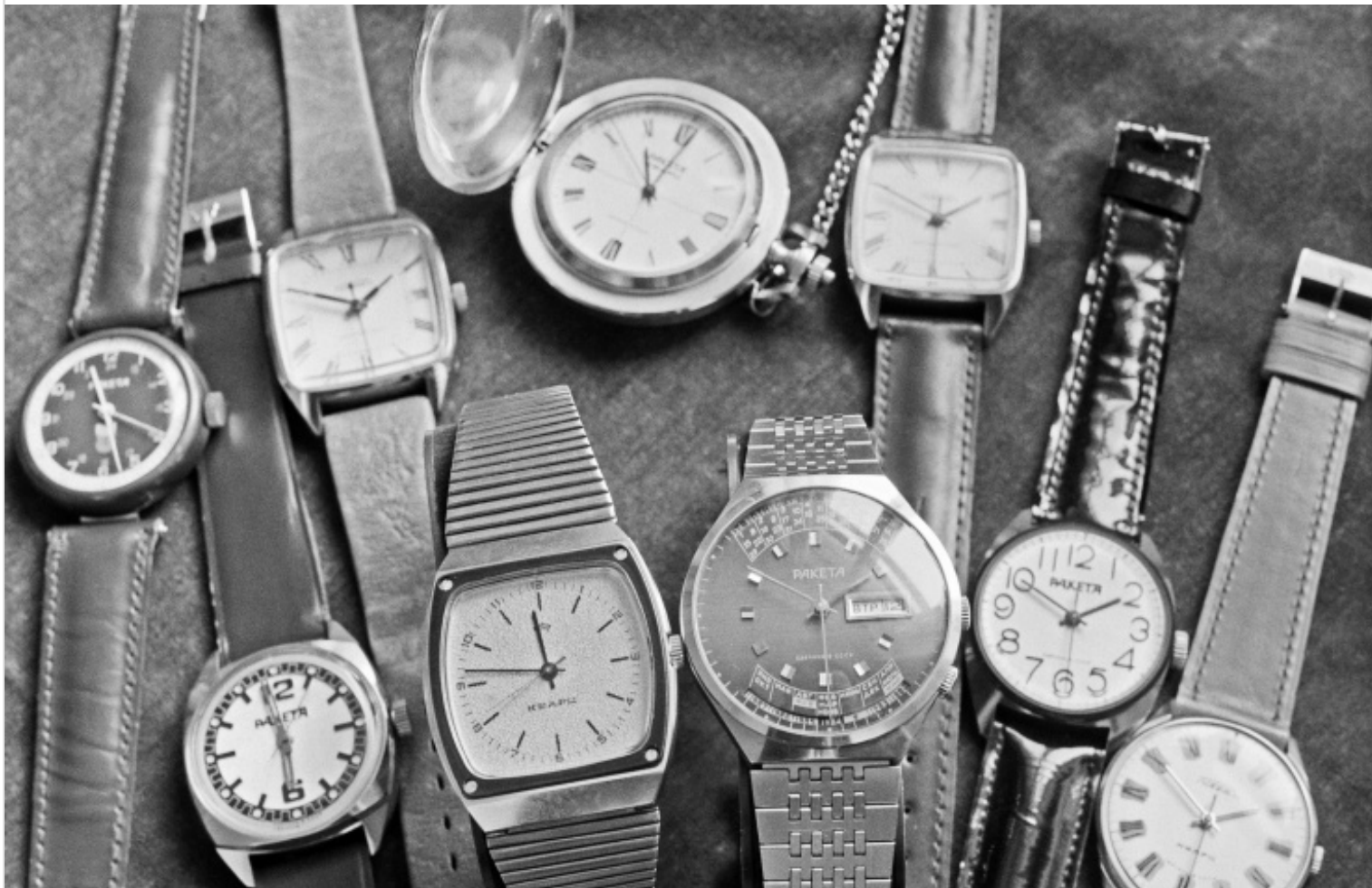
Часы с маркой "Ракета" Петродворцового часового завода

Создавая транспортную инфраструктуру сочинского региона